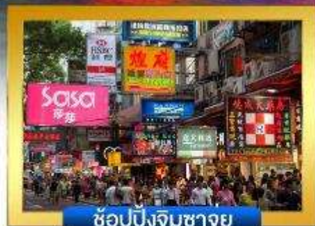
ช้อปปิงจิมซาจู้