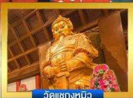
วัดเขกงหมิว

📍 อีสระ-ช้อปปิงย่านจิมซาจู้ & คอสเวย์เบย์