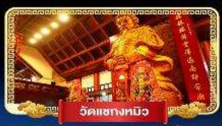
วัดเข่งหมิว