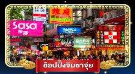
ช้อปปิ้งจิมซาจู้