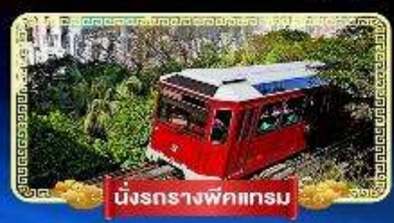
นั่งรถรางพิกเจอร์

นั่งกระเช้ามองปิง 360 องศา บินลัดฟ้าไปมู..สู่เกาะฮ่องกง