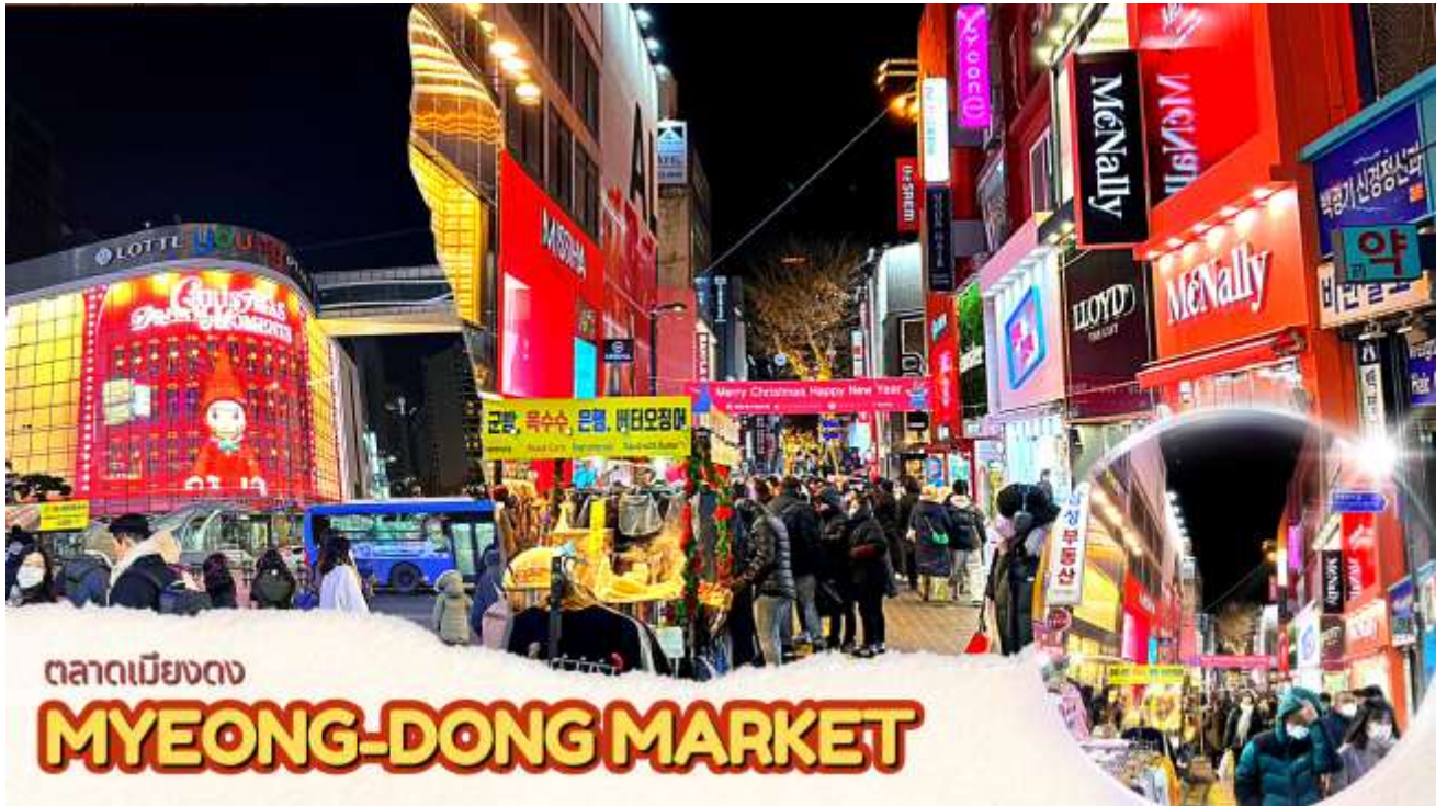
ตลาดเมียงดง MYEONG-DONG MARKET

จากนั้นนำท่านช้อปปิ้งย่าน เมียงดง หรือสยามสแควร์เกาหลี หากท่านต้องการทราบว่าแพชั่นของเกาหลีเป็นอย่างไร ก้าวล้ำนำสมัยเพียงใดท่านจะต้องมาที่เมียงดงแห่งนี้ พบกับสินค้าวัยรุ่น อาทิ เสื้อผ้าแฟชั่นแบบอินเทรนด์ เครื่องสำอางต่าง ๆ ของเกาหลี พบกับความแปลกใหม่ในการช้อปปิ้งอีกรูปแบบหนึ่ง ซึ่งเมียงดงแห่งนี้จะมีวัยรุ่นหนุ่มสาวชาวโซมไปรวมตัวกันที่นี้กว่าล้านคนในแต่ละวัน