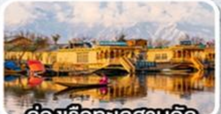
ล่องเรือทะเลสาบดิล +นอนบ้านเรือ 1 คืน