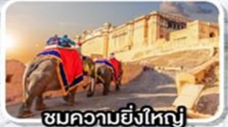
ชมความยิ่งใหญ่ ป้อมอัครา