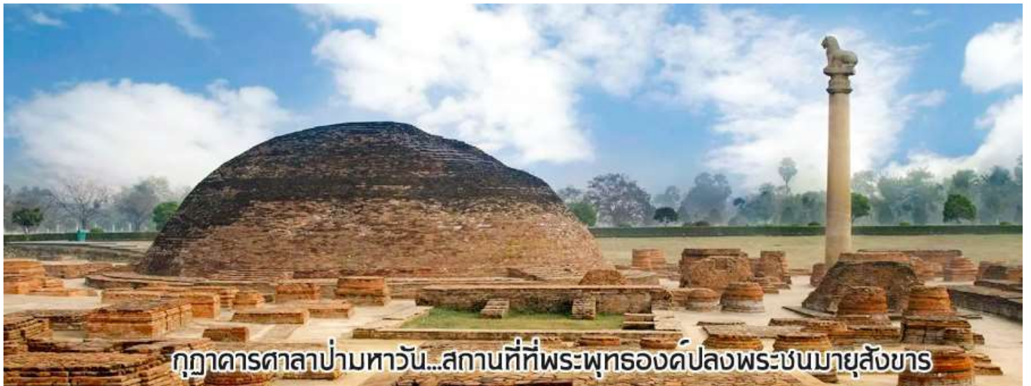
กุฎาคารศาลาป่ามหารวัน...สถานที่ที่พระพุทธองค์ปลงพระชนมายุสังขาร

นำท่านเดินทางต่อสู่เมือง กุสินารา (เดินทางประมาณ 4 ชั่วโมง)เมื่อถึงกุสินาราแล้วเดินทางไป วัดไทยกุสินาราเฉลิมราชย์ วัดนี้สร้างขึ้นเพื่อน้อมเป็นพุทธบูชาและเฉลิมพระเกียรติพระบาทสมเด็จพระเจ้าอยู่หัวในวาระครองสิริราชสมบัติครบ 50 ปี และเฉลิมพระชนมพรรษาครบ 6 รอบ 72 พรรษา พระบาทสมเด็จพระเจ้าอยู่หัวพระราชทานชื่อวัดให้ เชิญท่านร่วมทำบุญตามกำลังศรัทธา