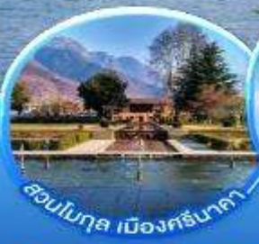
สวนโมกุล เมืองศรีนาคา