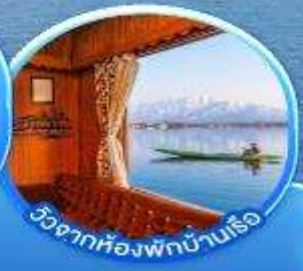
วิวจากห้องพักบ้านเรือ