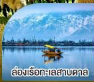
ล่องเรือทะเลสาบคาล