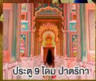
ประตู 9 โดม ปาตริกา