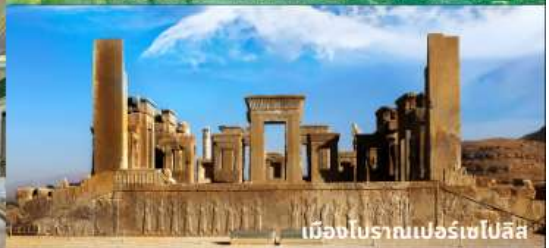
เมืองโบราณเปอร์เซโปลิส