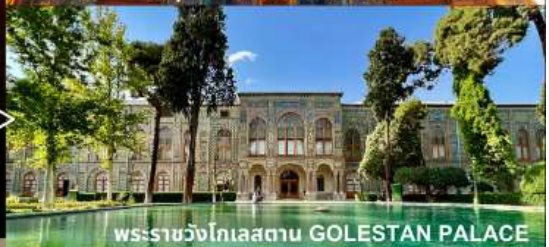
พระราชวังโกเลสถาน GOLESTAN PALACE