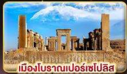
เมืองโบราณเปอร์เซโปลิส

✈️ บินตรง กรุงเทพฯ - เตหะราน คืนภายใน ชีราซ - เตหะราน