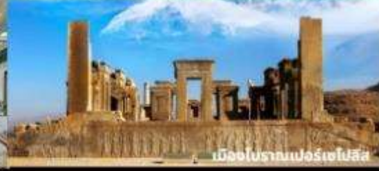
เมืองโบราณเปอร์เซโปลิส