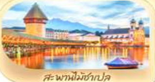
สะพานไมซ์าเปล