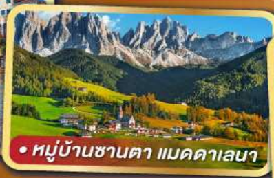
• หมู่บ้านซานตา แมดดาเลนา