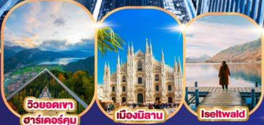
วิวยอดเขา ชาร์เตอร์คัม