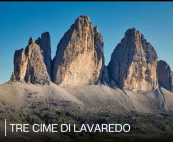
TRE CIME DI LAVAREDO