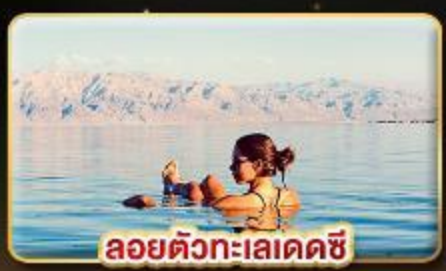
ลอยตัวทะเลเดคซี