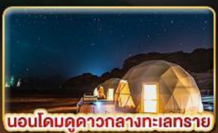
นอนโดมคูดาวกลางทะเลทราย