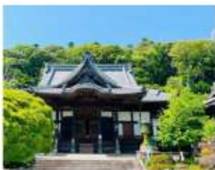
รับประทานอาหารกลางวัน ณ กิตตาคาร

"วัดชูเซนจิ" เป็นวัดเก่าแก่ที่มีประวัติศาสตร์ยาวนานกว่า 1,200 ปี อาคารต่างๆ ภายในวัดล้วนมีความเก่าแก่และงดงาม สะท้อนถึงศิลปะการก่อสร้างแบบดั้งเดิมของญี่ปุ่น เดิมชื่ "สวนป่าไผ่" เป็นอีกหนึ่งไฮไลท์ที่ไม่ควรพลาด เมื่อเดินเข้าไปในสวน คุณจะสัมผัสกับความสงบและความร่มรื่นจากต้นไผ่ที่เรียงรายกันเป็นแถว เสียงใบไผ่กระทบกันเบาๆ จะทำให้คุณรู้สึกผ่อนคลาย