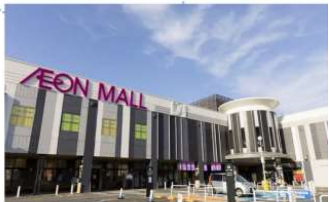
อีสระอาหารกลางวันตามอียูเอทีย (ไม่รวมในรายการ)