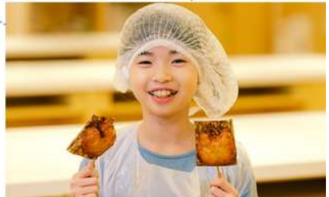
รับประทานอาหารกลางวัน ณ กิตตาคาร