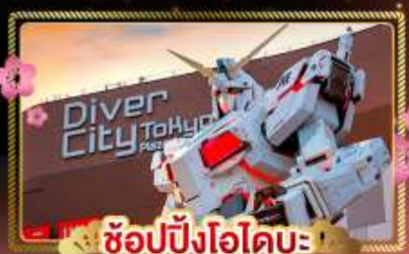
ช้อปปิ้งไอโดบะ

สายการบิน Full service พร้อมอาหารบนเครื่อง