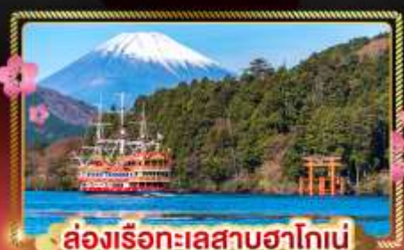
ล่องเรือทะเลสาบฮาโกเน่