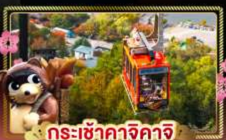
กระเช้าคางิจากิจิ