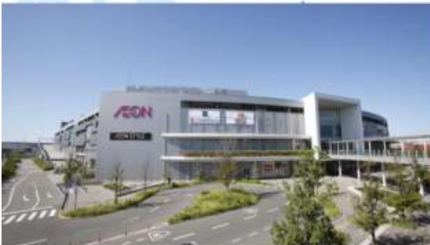
SHOPPING AT AEON MALL RINKU SENNAN/TSUKIGESHO FACTORY

"อีออนมอลล์ ริงกุ เซนบัน" เป็นห้างสรรพสินค้าขนาดใหญ่ ตั้งอยู่ใกล้สนามบินคันไซ เหมาะสำหรับนักท่องเที่ยวที่ต้องการหาของฝาก หรือช้อปปิ้งสินค้าแบรนด์ดังต่างๆ ที่มีร้านค้าให้เลือกมากกว่า 170 ร้าน รวมถึงซูเปอร์มาร์เก็ตขนาดใหญ่ที่มีสินค้าให้เลือกหลากหลาย