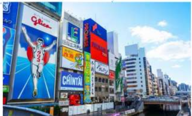
SHOPPING AT SHINSAIBASHI

"โรงงานชิกิกะโช" ชมมินิรูสมน ของฝากสุดคลาสสิกจากโอซาก้า มีขนมหวานมากกว่า 100 ชนิด รวมถึงขนมและเค้กญี่ปุ่น ท่านสามารถเพลิดเพลินกับการช้อปปิ้งขนมหวานได้ตามใจชอบ