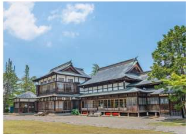
VISIT YUESUGI SHRINE