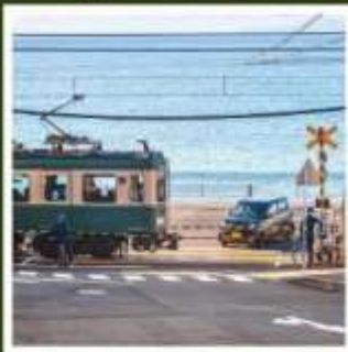
รถไฟเอโบะเด็น