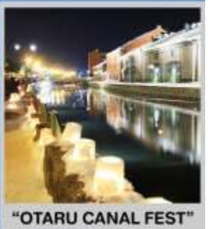
"OTARU CANAL FEST"