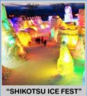
"SHIKOTSU ICE FEST"