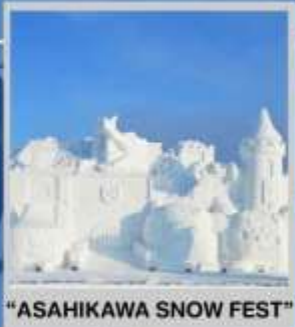
"ASAHIKAWA SNOW FEST"