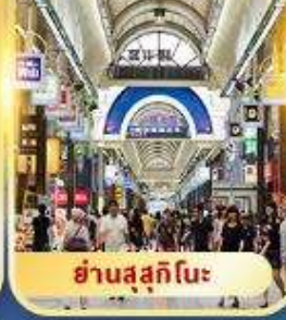
ย่านสุซุกิโนะ