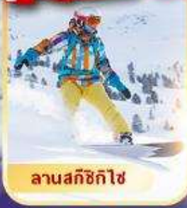
ลานสกีซิกิไซ