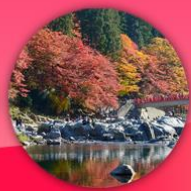
หุบเขาโคริงเค