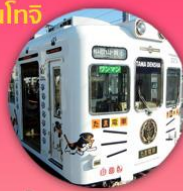
นั่งรถไฟทามะ