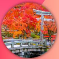
วัดเออิทังโตะ