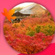
วัดโทฟุคุจิ