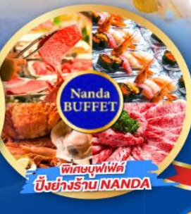
พิกะบุฟเฟ่ต์ บึงย่างร้าน NANDA

เดินทาง (วันปีใหม่ 2568) 27 ธ.ค.-01 ม.ค. 68 29 ธ.ค.-03 ม.ค. 68