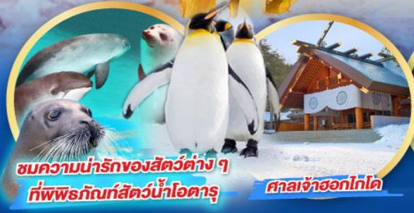
ชมความน่ารักของสัตว์ต่างๆ ที่พิพิธภัณฑ์สัตว์น้ำโอตารุ