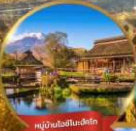
หมู่บ้านโงชิโนะฮะโกะ