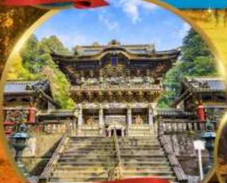
ศาลเจ้านิกโกโทโฮกุ