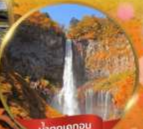
น้ำตกเคกอน