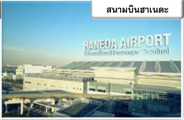
สนามบินฮาเนดะ

เวลา 20.30 น. พร้อมกันที่ ท่าอากาศยานสุวรรณภูมิ อาคารผู้โดยสารขาออกระหว่างประเทศ เคาน์เตอร์ สายการบินไทย เจ้าหน้าที่คอยให้การต้อนรับ ดูแล ด้านเอกสาร เช็คอิน และสัมภาระในการเดินทาง