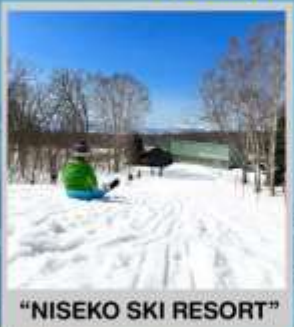
"NISEKO SKI RESORT"