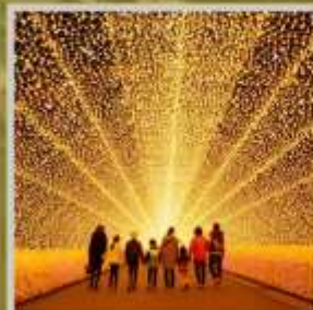
"NABANA NO SATO"