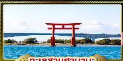
ทะเลสาบฮามานะ