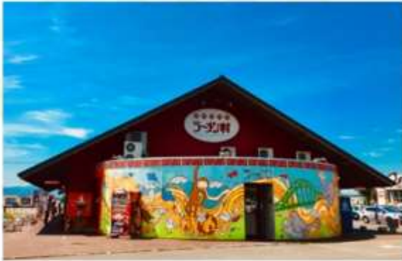
RAMEN VILLAGE ASAHIKAWA