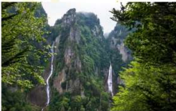
RYUSEI & GINGA WATERFALLS