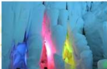
KAMIKAWA ICE PAVILLION