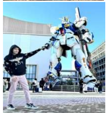
หุ่นกันดั้ม ชื่อ RX93 FF Nu Gundam

เดินทางต่อไปยัง ร้านค้า DUTY FREE ให้ท่านได้ช้อปปิ้งสินค้าปลอดภาษีที่มีคุณภาพ อาทิ เครื่องสำอาง โฟมล้างหน้า(แนะนำ) อาหารเสริม ขนม เครื่องใช้ต่างๆ ฯลฯ ...จากนั้นแวะ แชะรูปกับหุ่นกันดั้มยักษ์ ณ ห้าง LaLaport (หากมีเวลาพอ) มีขนาดใหญ่กว่า Unicorn Gundam ที่โตเกียวและใหญ่กว่า RX93 FF Gundam ที่ Gundam Factory Yokohama เรียกได้ว่าเป็นแลนด์มาร์คสำคัญของเมืองฟูกูโอกะในปัจจุบัน ...จากนั้นอิสระให้ท่านช้อปปิ้ง ย่านเทนจิน (Tenjin) หรือ ย่านฮาคาตะ (Hakata) เป็นย่านช้อปปิ้งขนาดใหญ่ใจกลางเมือง รวบรวมแหล่งบันเทิง อย่างครบครัน ไม่ว่าจะเป็นตึกต้นไม้ ร้านค้าที่น่าสนใจ และบรรยากาศสุดคลาสสิก หรือจะเป็นย่านของกินอร่อยๆ อย่างย่านยะไต (Yatai) หมายถึง ชุมชนอาหารที่มีขนาดไม่ใหญ่มาก ที่รวมร้านอาหารแบบฉบับท้องถิ่นเอาไว้มากมาย