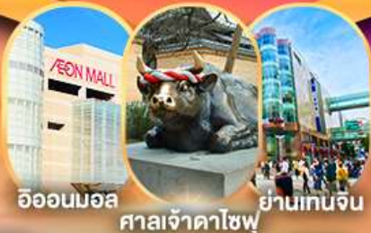
อีออนมอลล์ ศาลเจ้าดาโชฟู ย่านเทนจิน