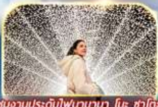
ชมงานประดับไฟนาฮานา ในะ ซาโตะ