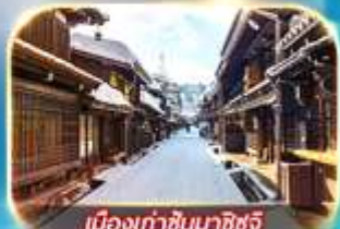
เมืองท่าชินมาชิซูจิ