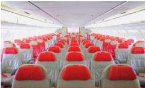
เครื่องลำใหญ่ 377 ที่นั่ง

ตัวเครื่องบินเป็นตัวกรู๊ปสำหรับคณะทัวร์ ระบบของสายการบินจะทำการแรนดอมที่นั่ง ซึ่งไม่สามารถเลือกหรือเลือกกระบุนั่งได้ หากลูกค้าต้องการเลือกกระบุนั่ง ทางสายการบินมีบริการอัพเกรดที่นั่ง (ค่าบริการเป็นไปตามที่สายการบินกำหนด)