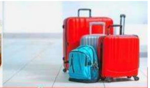
น้ำหนักกระเป๋า สูงสุด 20 กก.

08:40 ถึง สนามบินคันไซ ประเทศญี่ปุ่นดินแดนอาทิตย์อุทัย