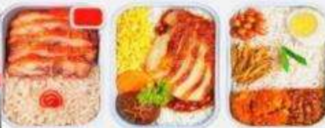
บริการอาหารร้อน ทั้งขาไป-ขากลับ