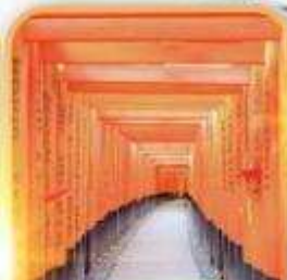
ฟูชิมิ อินาริ