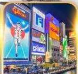
ชินไซบาชิ