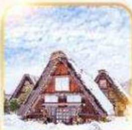
หมู่บ้านอิระคาวาโกะ

โอซาก้า นาโกย่า เกียวโต ฮิระฮิเมะ 1 วันเต็ม