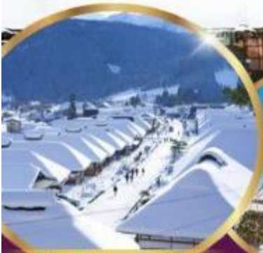
หมู่บ้านโบราณ โออุจิ จุกุ