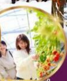
บุฟเฟต์ สดอเมอริ เก็บสดจากต้น