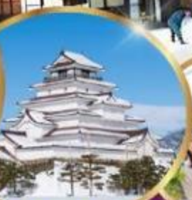
ปราสาท สึรุกะ