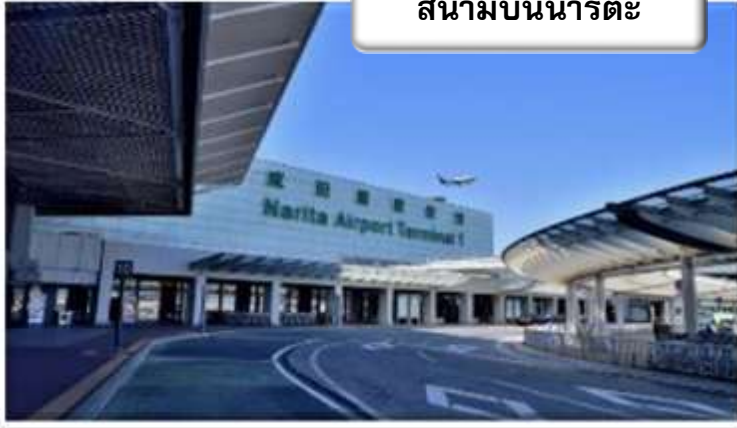
สนามบินนาริตะ

เวลา 02.25 น. ออกเดินทางสู่ สนามบินนาริตะ ประเทศญี่ปุ่น โดย สายการบินไทยแอร์เอเชียเอ็กซ์ เที่ยวบินที่ XJ 602