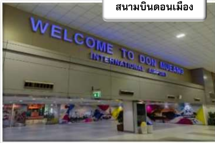
สนามบินดอนเมือง

เวลา 23.30 น. พร้อมกันที่ สนามบินดอนเมือง อาคารผู้โดยสารขาออกระหว่างประเทศเคาน์เตอร์ สายการบินไทยแอร์เอเชีย เอ็กซ์ เจ้าหน้าที่คอยให้การต้อนรับ ดูแลด้านเอกสาร เช็คอิน และสัมภาระในการเดินทาง