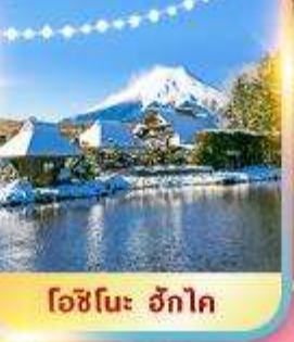
โอะชิโนะ ฮักโค