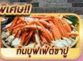
กินบุฟเฟ่ต์ซาปู