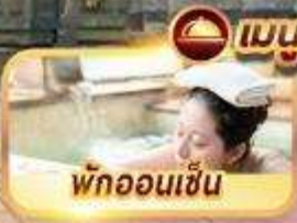
พักผ่อนเซ็น