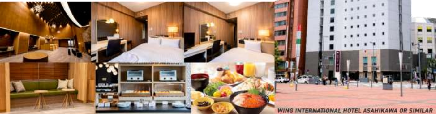
WING INTERNATIONAL HOTEL ASAHIKAWA OR SIMILAR

ที่พัก WING INTERNATIONAL HOTEL หรือ ART ASAHIKAWA, หรือเทียบเท่า