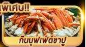
กินบุฟเฟ่ต์ซาซุ