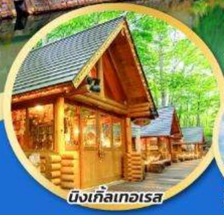
บึงเกลือเทอเรส