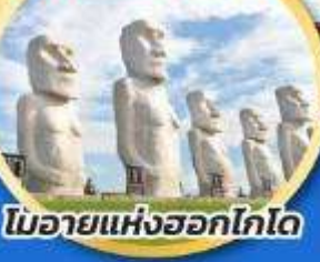
โมอายแห่งฮอกไกโด