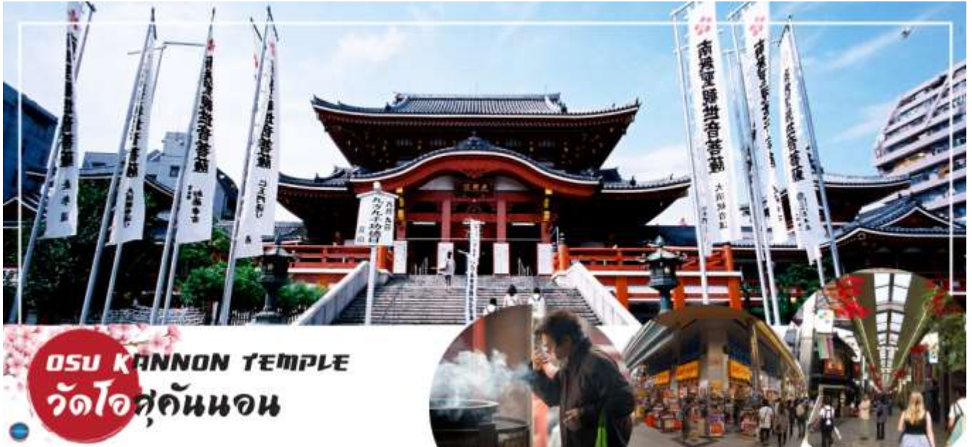
OSU KANNON TEMPLE วัดโอสถคันนอน

เมืองนาโกย่า – วัดโอสถคันนอน – ถนนช้อปปิ้งโอส – สวนดอกไม้มะนะนะ โนะ ชาโตะ – แฉ็ช ดริม เอ๊าท์เล็ท