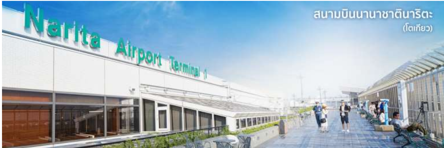
สนามบินนานาชาตินาริตะ (โตเกียว)

10.55 น. เดินทางถึง ท่าอากาศยานนานาชาตินาริตะ ประเทศญี่ปุ่น (เวลาที่ประเทศญี่ปุ่นจะเร็วกว่าประเทศไทย 2 ชม.ควรปรับนาฬิกาของท่านเพื่อสะดวกในการนัดหมาย) นำท่านผ่านขั้นตอนการตรวจคนเข้าเมืองและศุลกากร พร้อม ตรวจเช็คสัมภาระ เรียบร้อยแล้ว สำคัญมาก!! ประเทศญี่ปุ่นไม่อนุญาตให้นำอาหารสด เนื้อสัตว์ พืช ผัก ผลไม้ เข้าประเทศ หากฝ่าฝืนมีโทษปรับและจับ