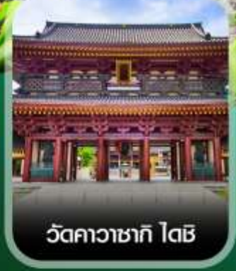
วัดคาวาซากิ ไตชิ