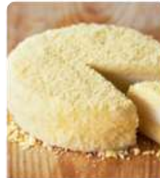
ร้าน LeTAO ร้านมีผลิตภัณฑ์อร่อย อีกรอบมาจาก ร้านกาแฟชื่อดังในโตเกียวเมือง ด้วยนางลาวกลอนบิวตี้บิงกิ้ง