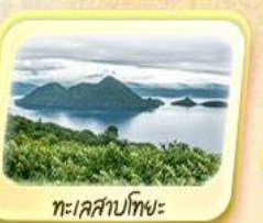
ทะเลสาบโทยะ