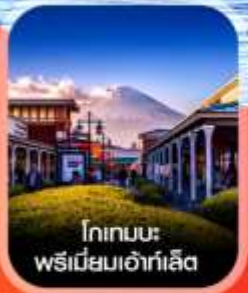
โกเทมบะ พรีเมียมเอ้าท์เล็ต