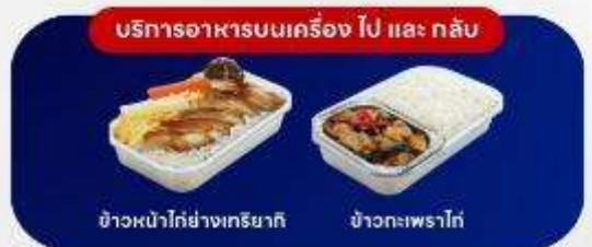
บริการอาหารบนเครื่อง ไป และ กลับ