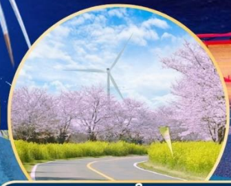
ซากุระ / ทุ่งดอกเรป