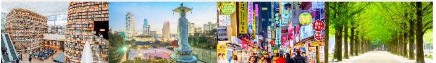
STARFIELD COEX MALL