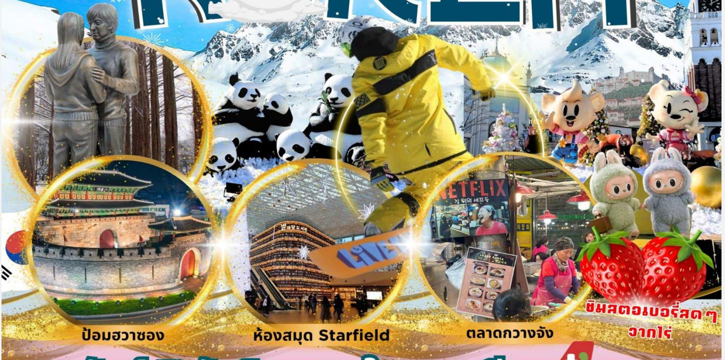
ป้อมชวาของ