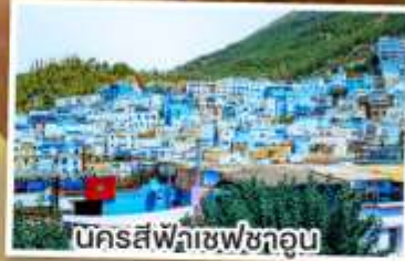
นครสีฟ้าเซฟซาอูน