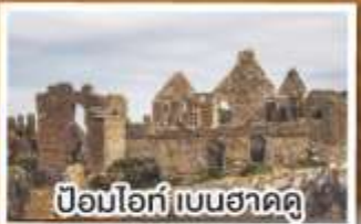
ป้อมโอ๊ก์ เบนฮาดดู