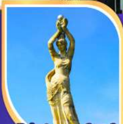
จูไห่ฟิชเชอร์เทิร์ล